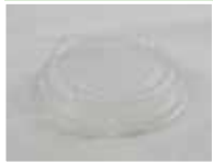
Artículo 3374 Apto para la serie 3357 2000/caja, 20000/tarima