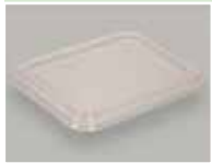
Artículo 7590FL Apto para la serie 7590 300/caja, 2400/tarima