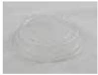
Artículo 3362 Apto para la serie 3357 2000/caja, 20000/tarima